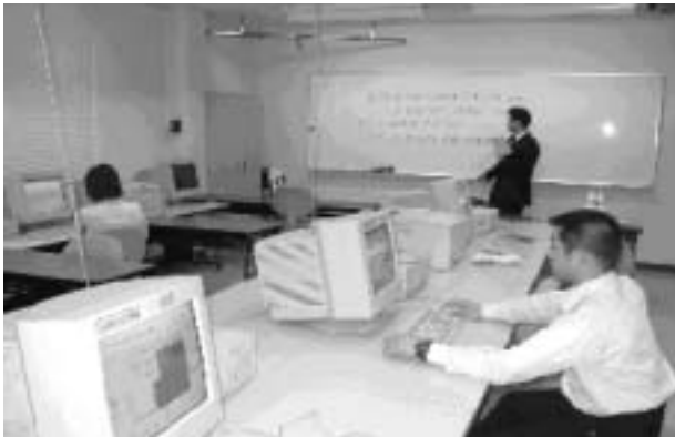
写真1 若手職員によるパソコン勉強会