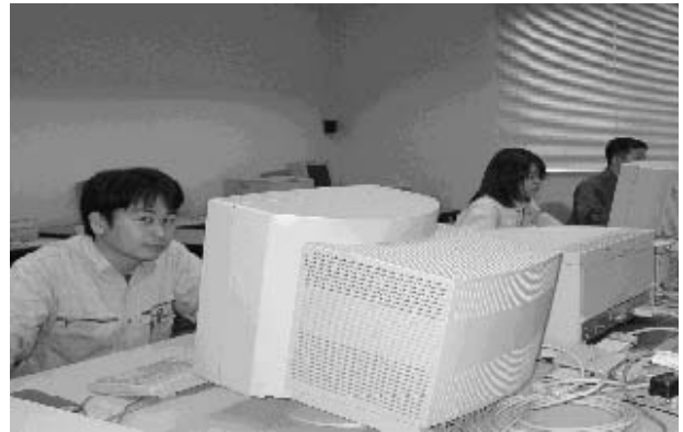
写真2 講師と受講生によるマニュアル作成