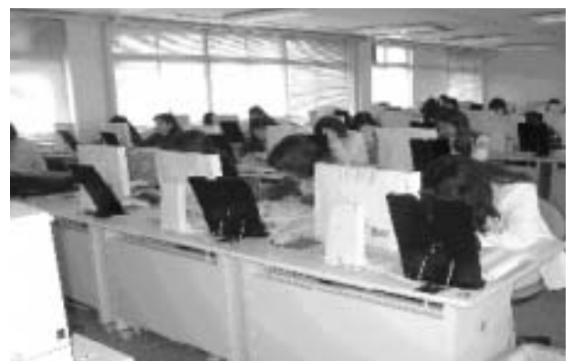
写真3 アビリティ訓練生へのSCOPE実施 （ビジネスワーク科）

ここでのコミュニケーションのポイントは、相手の存在感を認め、「知恵」と「経験」は「国の宝」、ここから話がスタート。すると、次のような感想も