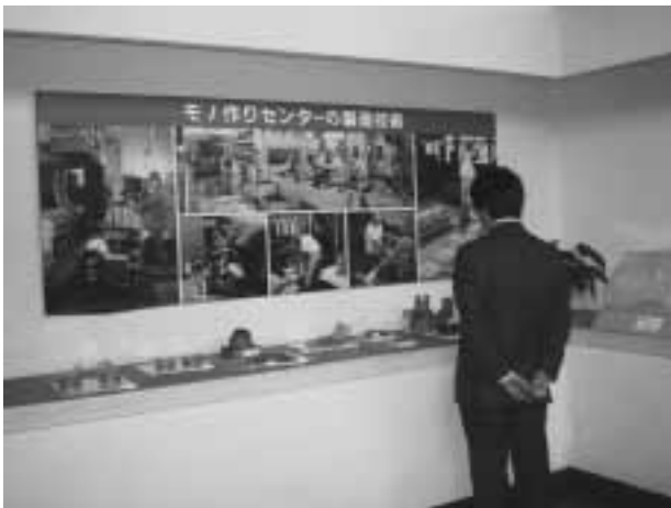
図4 モノづくりセンター

ポリテクセンター京都さんにご協力いただいています。高卒技能系採用の新入社員がいます。当社は島津工科学校という企業内の職業訓練校を持っていますが、なにぶん機械加工につきまして設備等の関係もあり、きちんとした教育内容が実施できる状況ではございません。ですから、ポリテクセンター京都さんのほうで主に旋盤とフライス盤の研修を実施していただいています。旋盤とフライス盤の研修では、初級段階から始め技能検定2級のレベルまで、新入社員は1年間で3回に分けて研修いたします。ポリテクセンター京都さんのほうでカリキュラムを作成していただきまして、1回あたり10日間ずつ訓練を実施していただいております。機械加工科ですと、最終的に技能照査の合格レベルまでの研修を実施していただいております。技能照査は私ども