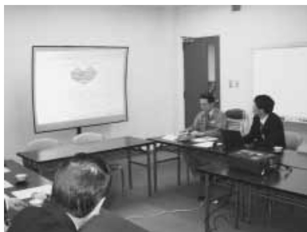
図2 インタビュー風景

新人教育を中心に、主な教育制度をご紹介します。島津の一員となった新入社員を対象に、島津をよく知りその後の仕事に必要な基礎を身に付けさせることを目的に新人研修を実施しています。入社後約4週間で、ビジネス上の基礎知識と英会話の習得を目