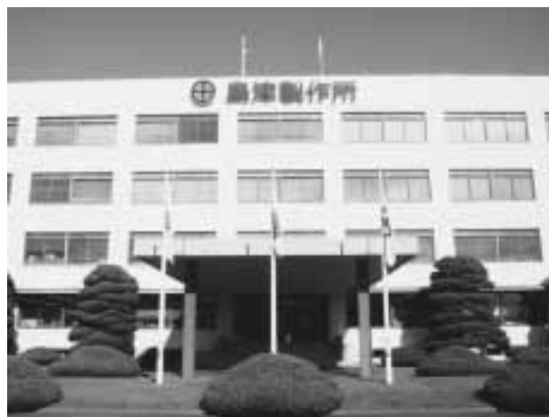
図1 (株)島津製作所本社の外観

1997年6月に三条地区において、地球環境の改善を図るツールとして開発されたISO-14001環境マネジメントシステムの認定を取得し、これを本社地区事業所としての認定へと発展させ、1999年2月には秦野工場で、2000年10月には海外関係会社島津フィリピン（SPM）でも取得しました。その要求事項に沿って、地球環境改善へ向けて着実な取り組みを続けています。「人と地球の健康」を合い言葉に、環境マネジメント活動を推進するとともに、環境計測機器、生分解性プラスチックなどの環境関連製品を開発・提供しています。今後は、リサイクルを重