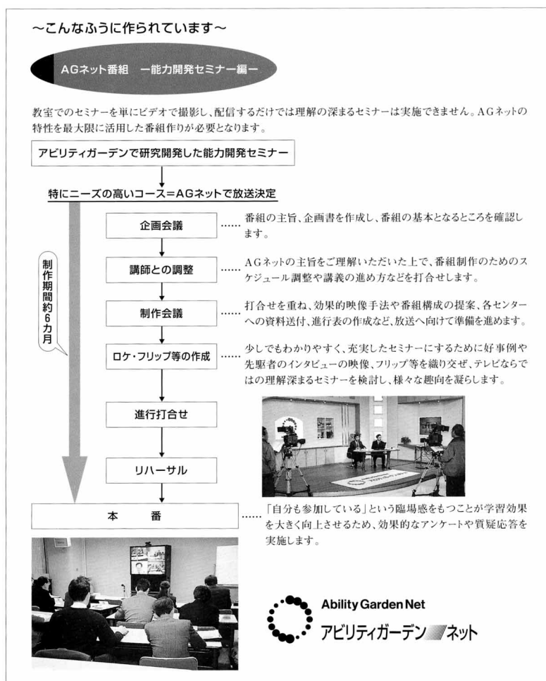
図2 AGネット番組ができるまで