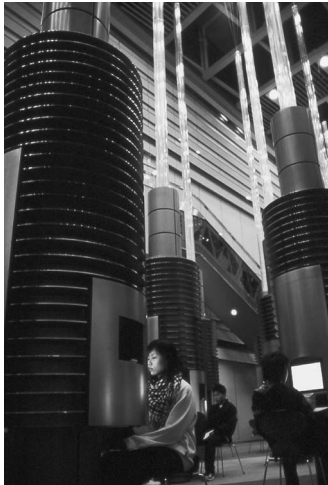
じぶん発見 「じぶん発見オリエンテーリング」