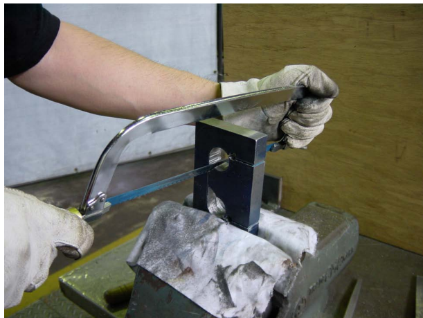
Cクランプ弓のこ作業

わが国は品質の良いものを作って世界の国々に輸出して豊かな暮らしが成り立っている。それは、日本製品の信用が命であり、私だけが少々は手を抜いてもいいだろうといった、ものづくりに対する姿勢が緩んだときに改ざんや偽装につながっていき、やがてはそれが形をなして製品の中に残されて、信用を失うという取り返しのつかない事態になるのであると思われる。そうであるからこそ職業訓練は、技能と技術を支える手のすばらしさを再認識して指導しなければいけないと思うのだが、どうだろう。