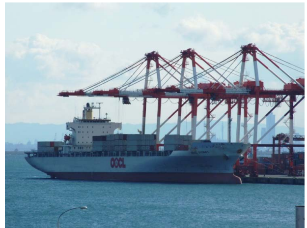
校舎から望むコンテナ船と巨大なガントリークレーン