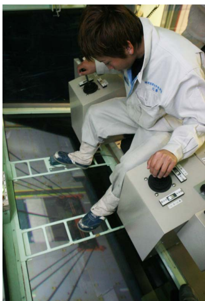
シート下のモニターには 運転席の窓から見える映像が映し出され、 波や風による運転席の揺れを再現することが可能

などの免許取得に向けた実習も行っており、港湾・物流業界へ就職するときに必要となる専門的な知識や技能を身につけることができます。