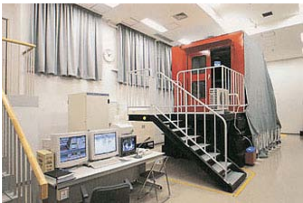
日本で唯一のコンテナクレーンシミュレータ

本校では港湾・物流業界のみならず、最近ではさまざまな業界で求められるコンピュータネットワークやデータベースなどの情報処理に関する学習をはじめ、フォークリフト運転技能の習得など、主に港湾・物流業界へ就職する際に必要な知識・技術を学ぶことができるほか、クレーン運転士、大型特殊自動車