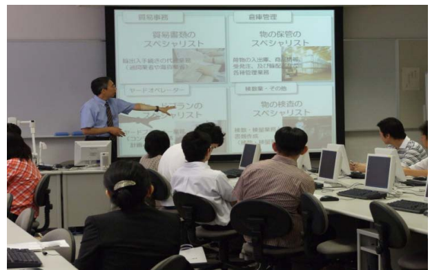
オープンキャンパス風景

卒業後の就職率は例年ほぼ100%で、そのうち約9割が港湾・物流関連企業に就職しております。本校では、港湾・物流業界の未来を担う人材を輩出しており、高い就職率と定着率により各企業・団体様から信頼をいただいております。