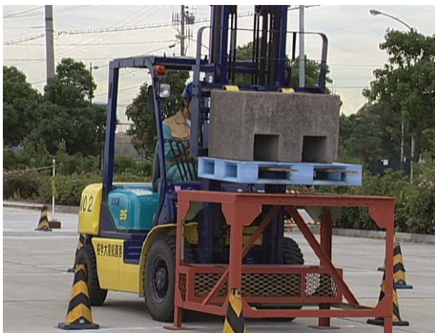
港湾技術科授業風景

在学中に「フォークリフト運転技能講習」や「玉掛け技能講習」の資格だけでなく、「移動式クレーン運転実技教習」の資格を取得することが可能であり、また、「クレーン運転士」や「大型特殊自動車運転」などの免許取得に向けた実習を行っています。