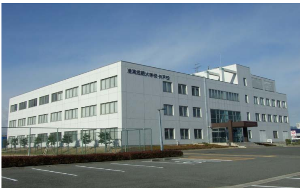
ポリテクカレッジ神戸港全景

本校では、1学科20～30名の少人数教育を行い、学生と指導員がひざを交えたマン・ツー・マン教育