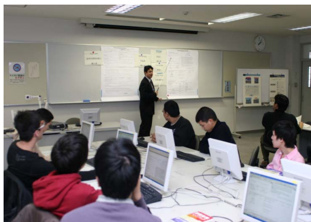
港湾流通科授業風景

主なカリキュラムとして、貿易概論・データ工学・港湾総論などの学科のほか、通関実務実習・データ処理実習・ストウエージプラン（積卸し計画）作成