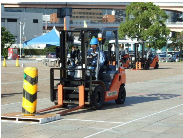
神戸港フォークリフト荷役技能向上大会

「安全・確実・迅速」という、フォークリフトの基本操作を競い合うことで、フォークリフト荷役技能のより一層のレベルアップを目指し、港湾労働災害の防止に寄与するとともに、神戸港の優秀な荷役を広くPRするため、関係官庁や港湾関連団体等の神戸港関係各界をあげて組織する「神戸港フォークリフト荷役技能向上大会実行委員会」による「神戸港フォークリフト荷役技能向上大会」に、神戸港の港湾企業から選出された人たちとともに、本校からも参加し、方向変換・屈折コース、ジグザグコース