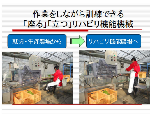
リハビリ機能付き姫ねぎウレタン切断機

足腰がふらつく障害者が働きにやってきました。当然、安全に仕事をしていただくためには座ってできる作業を選択します。しかし、仕事を選択することによってこの障害者は、一日中座っているということになります。本来は、リハビリセンターで訓練することが望ましいのですがそうすると仕事はできなくなってしまうというのが実情なのです。