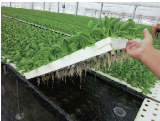
京丸園ちんげん水耕栽培

現在、総勢72名（役員4名、社員4名、パート64名）の組織となっています。経営の柱である水耕部では、「毎日、緑を食卓に！」をテーマに京丸園姫ねぎ・京丸園みつば・京丸園ちんげんを周年栽培し全国40市場へ出荷しています。