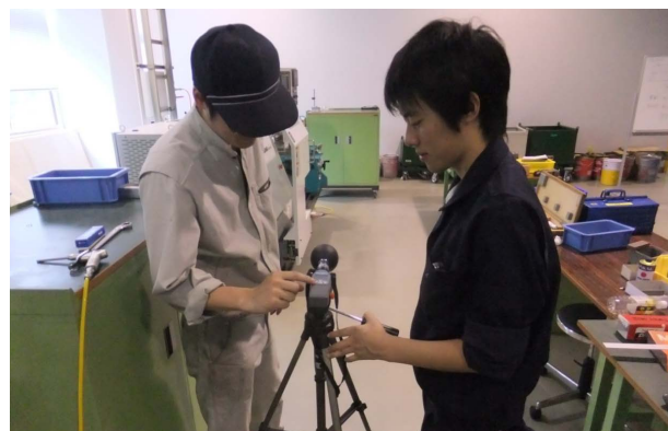
図3 WBGT測定（3年次生、夏期）