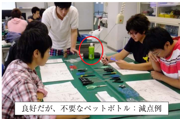
良好だが、不要なペットボトル：減点例

・上からの数字だけの安全もあるが、定着はない。安全の理念が1人ひとりに浸透するかが大切。一万分の一人からの気づき。一万人の一人の話をすれば、学生は傾聴し、ゼロ災の大切さを感じているのがわかる。【川崎製鉄の水島工場で、ある日一人の社員が労災事故で亡くなった。当時の工場の労働部長のAさんが早速弔問に訪ねると、20代半ばにして若き未亡人となってしまった奥さんが、涙も涸れ果