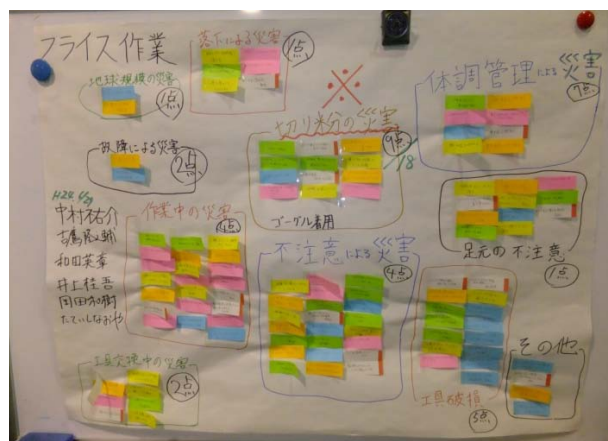
図7 衆知法によるフライス盤にひそむ災害

また、学生が危険の芽をどうとらえるかを「写真の工作機械(NC旋盤, NCフライス盤, 平面研削盤, 帯鋸盤)にひそむ災害」にて、ブレインストーミン