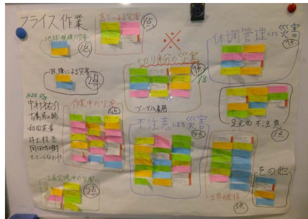
図7 衆知法によるフライス盤にひそむ災害

また、学生が危険の芽をどうとらえるかを「写真の工作機械(NC旋盤, NCフライス盤, 平面研削盤, 帯鋸盤)にひそむ災害」にて、ブレインストーミン