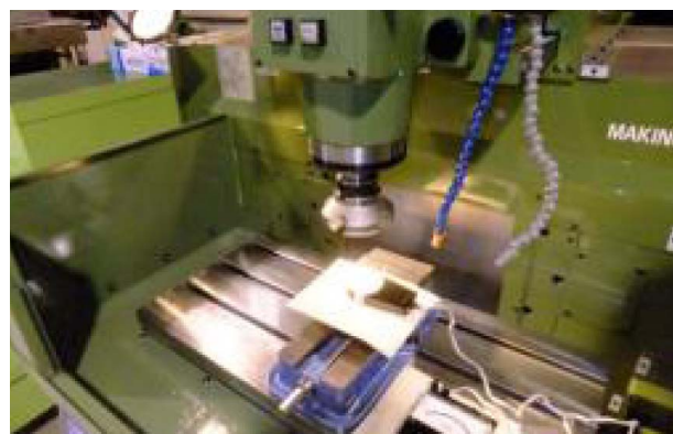
図4 JIS照度基準の確認