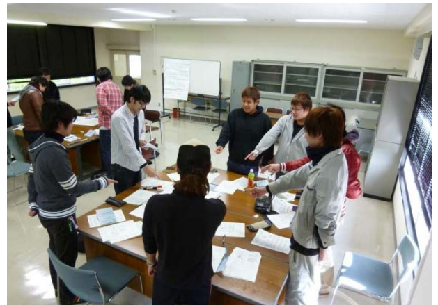
図2 KYT基礎4ラウンド法（4年次生）

(3) ヒューマンスキル、コンセプチュアルスキルの意識した活動として、安全衛生を醸成する風土づくりを実践する。4年次に「ひとりひとりカケガエノ