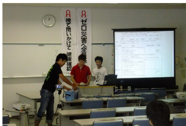
図5 熟練技能者演習（上）と同環境で学ぶ学生達