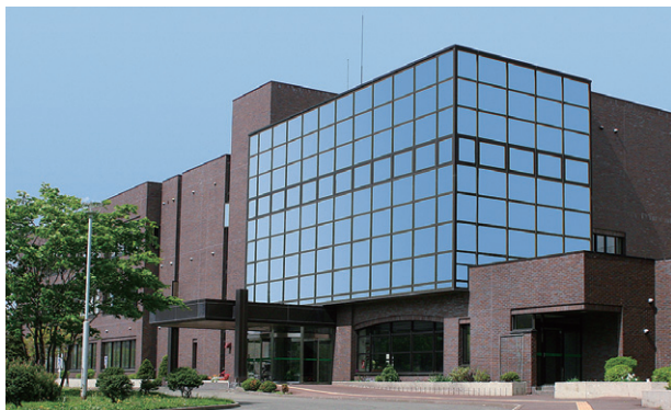
写真1 北海道立札幌高等技術専門学院の外観

同学院は、職業能力開発促進法に基づき、職業に必要な労働者の能力を開発及び向上させることによって、職業の安定と労働者の地位の向上を図るとともに、経済と社会の発展に寄与することを目的に、北海道が設置、運営しています。