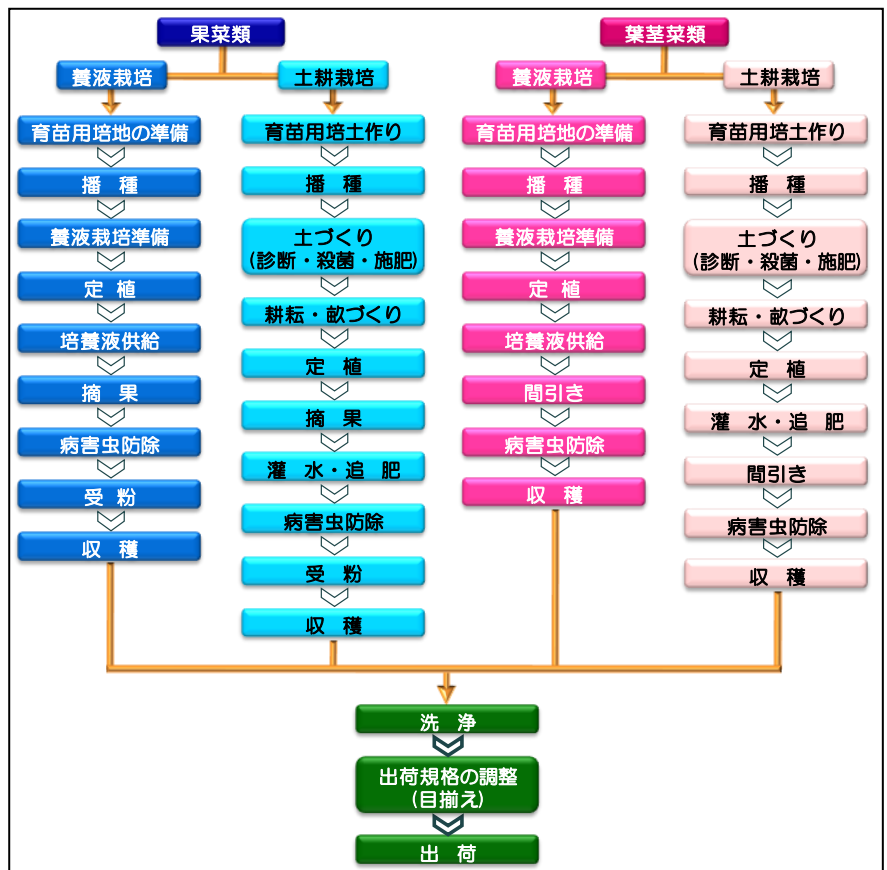
図表1:野菜作農業(施設野菜)の生産工程例

このデータ(職業能力体系のモデルデータ)は、「野菜作農業(施設野)」の標準的な仕事や作業等を整理したものです。自社で活用するにあたっては、本モデルデータをベースに自社の特徴などを付加して、オリジナルの職業能力体系のモデルデータを構築していただき、能力開発や教育訓の計画・実施に活用していただきますようお願いいたします。