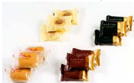
図1 「包装形態ピロータイプ」

「職業能力の体系」を整備するにあたっては、包装・荷造機械製造業の企業規模が多岐であるが、包装方式である「ピロータイプ（図1参照）」（方式選定には製袋充てん包装機として生産工程で多く使用され汎用性が高く、包装機械の生産出荷額が高い点）包装機に重きをおき、調査研究を行った。