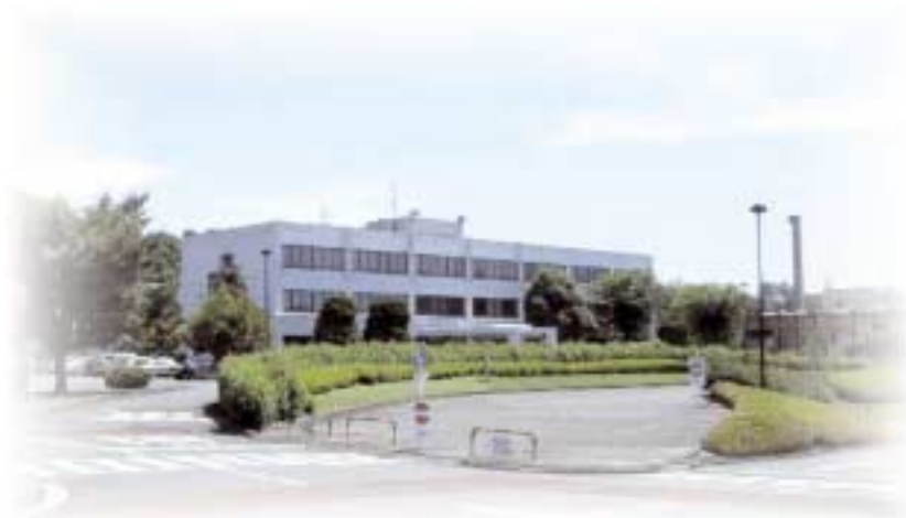
能力開発研究センター