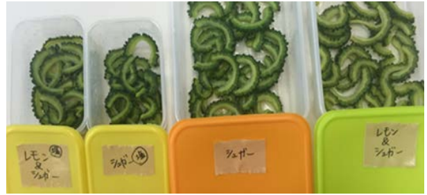
図2 砂糖とレモン汁を使って1日漬けたもの

③ゴーヤを塩あてして数分おき、3分茹でて冷水につけた。表面だけ削りアイスクリームの生地と混ぜた。結果：青臭さを取ることに成功した。