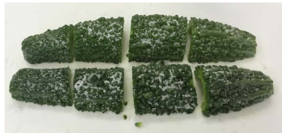
図3 ゴーヤの塩あて

③ゴーヤを塩あてして数分おき、3分茹でて冷水につけた。表面だけ削りアイスクリームの生地と混ぜた。結果：青臭さを取ることに成功した。