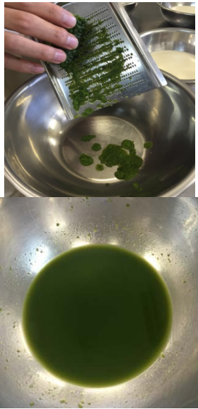
図2 ゴーヤの表面をすりおろして絞る