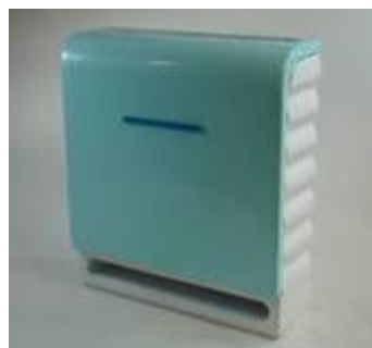
図2 医療福祉施設用 空気清浄機作品例