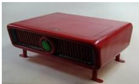
図1 パチンコパーラー用 空気清浄機作品例