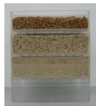
図3 浴槽水ろ過装置

このろ過装置で、浴槽水の汚れは処理できますが、大腸菌は処理できません。このため、処理した浴槽水は、再度「塩素処理」あるいは「紫外線処理」が必要です。