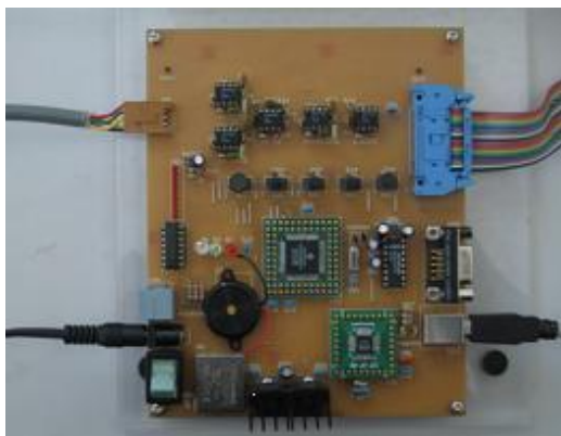
図2 計測用ハードウェア