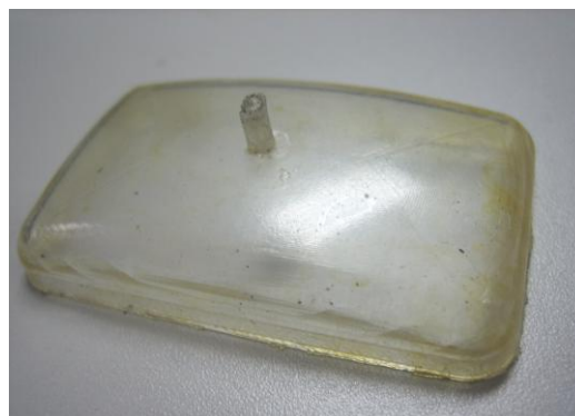
図4 製作した成形品