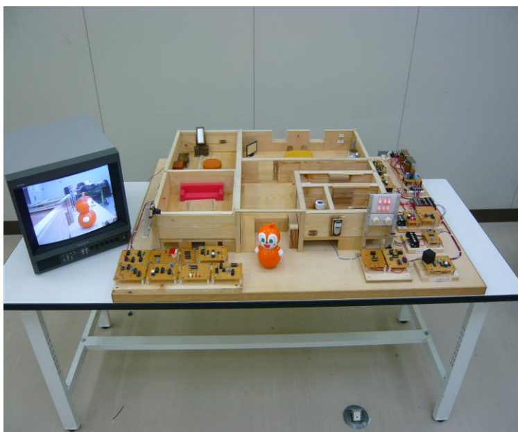
写真1. 制作したジオラマ

三色LEDを用いて赤、青、緑を表示する屋外表示器を作成しました。表示器の色にはそれぞれ意味があり、緑色LEDは異常が認められない場合常に点灯し、赤色LEDに変化した場合は屋内において住人の手助けが必要な状況を示しており、青色LEDに変化した場合は屋外で異常事態が起きた事を表わしています。また常に点灯している緑色LEDを利用して居住者の起床確認システムを考案しました。