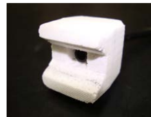
図4 本年度の吸吹口

この改善案を考えるために、問題となっている現象を的確に捉え、箇条書きにして検討するように指導しました。次に対策や改善方法を検討する際には、仮説に基づいて実験・検証を行い実機へ展開しました。本課題の音漏れ対策については、問題を分析する能力、メンバーの創意工夫、要件を満たす製作方法の検討などこれまでに習ってきた専門的な知識と技術を生かしながら、問題解決能力を付与できたと考えています。その後、ハーモニカの曲面を意識して把持する方法やバチのたたき方についても創意工夫が見受けられました。