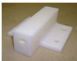
図2 H21年度製作の吸吹口

この装置の一番のポイントは、ハーモニカの「吸う・吹く」の動作および正確な位置決め動作を与えることです。口の部分を吸吹口と名付け、開発に取り組みました。昨年度は図2に示すようにRP(Rapid Prototyping)で製作しましたが、本年度は、図3に示すハーモニカ曲面に沿った型をRPで製作し、液体シリコンゴムを型に流しこみ成形しました(図4参照)。これにより、接触面を大きくすることが可能となり、音漏れを減少させました。停止位置もハーモニカの各穴へと停止させ確実な音を出すように工夫しています。