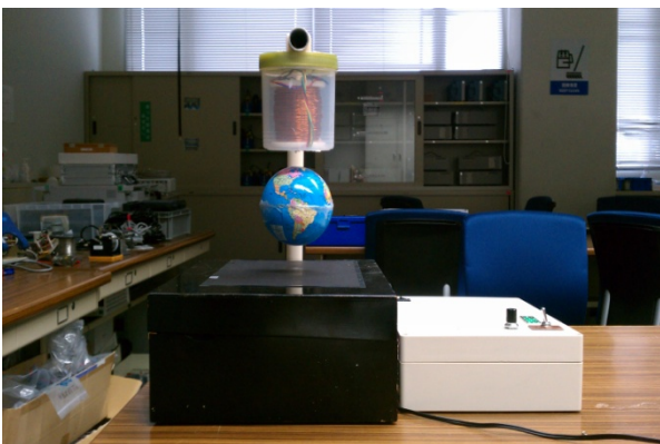
図1 磁気浮上と磁気浮上物体の回転数制御の外観