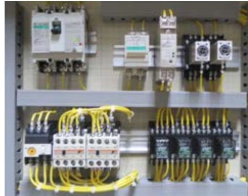
図2 製作した制御盤