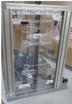
図5 製作した負荷装置

設計・製作した負荷装置は、制御盤の仕様どおりに制御可能なこと、できるだけ小型化することを目的とした。