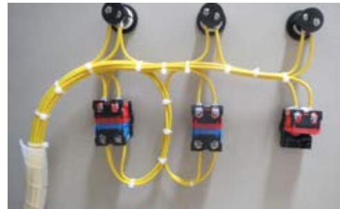
図3 制御盤のドア配線