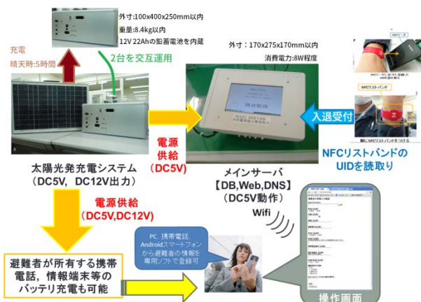
図 2 フェーズ 1 の避難所支援システムの開発概要

昨年度(平成 2 5 年度)のフェーズ 1 のシステム開発では実際の避難所での運用を想定し、電力インフラが喪失した状態でも本システムを運用できるよう電源供給部は太陽電池と鉛蓄電池による太陽光発電システムとした。また、鉛蓄電池を収容したケースと太陽電池に取手をつけ、持ち運びしやすいデザインとした。晴天であれば 5 時間で充電が完了できるうえ、災害前にあらかじめ家庭用電源により充電しておくことも可能となっている。太陽光発電システムの仕様は表 1 の通りである。