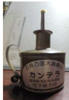
図 2-1 石見銀山の カンテラ

世界遺産である石見銀山では、銀堀をはじめたくさんの職人が働き、石見地区で暮らしていた。明治時代に入り、石見銀山の坑道内で働く人たちの灯りとして使われたのがカンテラである。図 2-1 にそのカンテラを示す。製作するカンテラは、石見銀山のカンテラを元に試作品を製作し(図 2-2)、その製作過程で出た課題を元にオリジナルのカンテラ(図 2-3)である。