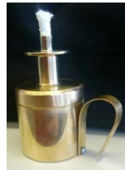
図 2-2 試作品