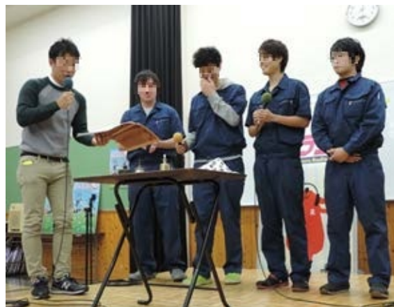
図5 公開生放送の様子