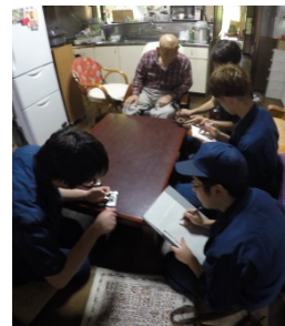
図 3 話を聞く光景