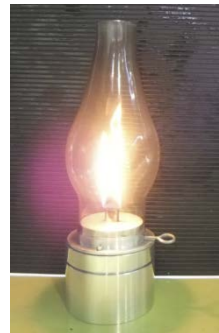
図 2-3 オリジナルカンテラ